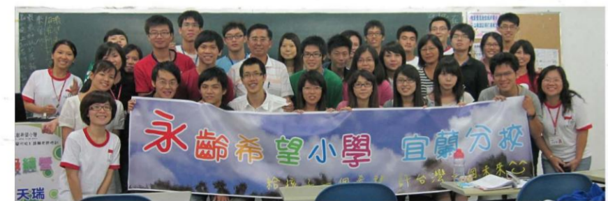
永齡希望小學99學年度第一學期宜蘭分校團體照

宜蘭大學於今年六月與永齡教育慈善基金會合作「永齡希望小學弱勢學童課輔計畫」。希望藉由「教育脫貧」幫助鄰近地區國小經濟、課業雙重弱勢學童進行課業輔導，招募並培訓宜蘭大學校內大學生(含研究所以上學生)為課輔老師，以每班6-8人的規模進行小班教學、每週9小時固定於國小放學後進行數學、英文科課業輔導，以學童「學習落後點」做為課輔的起點，奠定學習的基礎，培養負責任的態度，進一步提升學習成就，重建對課業學習的信心與能力。99學年度第一學期宜蘭分校服務聯合國小：礁溪國小、黎明國小、貴山國小、深溝國小、新生國小、同樂國小之六所國小，服務學童數為95人。未來永齡希望小學將服務更多學童，也歡迎更多熱情、活力、有愛心的宜大生們一起加入我們的行列。