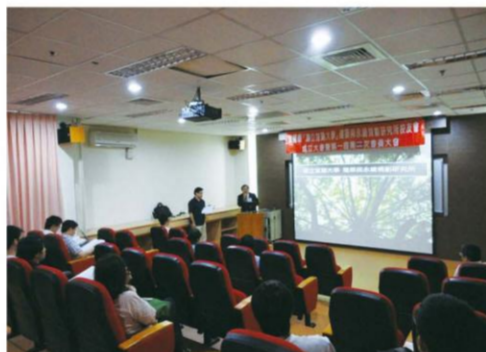
建築與永續規劃研究所