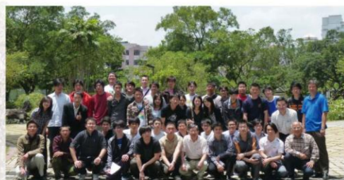
機械與機電工程學系