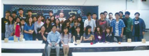
應用經濟與管理學系(所)