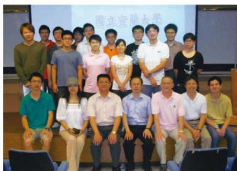
化學工程與材料工程學系(所)