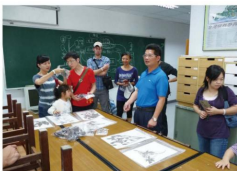
森林暨自然資源學系(所)