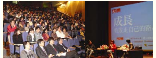
論壇現場與聽眾合影。

遇見大師系列講座第三場-「勇敢走自己的路」校園論壇，由天下雜誌記者王曉玟小姐主持，與談人為中文維基百科管理者許瑜真小姐與出版界名人譚光磊先生，進行精彩的生涯對話。而後播放《成長》影片--王建民，描述王建民從沒沒無聞到舉世聞名，並獲我國的十大傑出青年，努力不懈的成長故事。從兩位與談人的對話中，本校學生充分體會榮華富貴的真諦，江校長與宜蘭縣教育處呂健吉處長，亦期勉大家能從許瑜真與譚光磊的生涯故事中汲取經驗，以自省自己的生涯規劃。