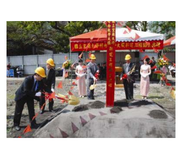
生物資源學院大樓新建工程現場。

於95年3月10日開工，預計於98年5月14日完成驗收，並訂於98年6月13日(星期六)舉行落成典禮，敬邀校友及各界長官蒞臨觀禮。生物資源學院大樓提供生物資源學院各系所，包括食品科學系、動物科技學系、園藝學系、自然資源學系、生物機電工程學系、生物技術研究所及農業推廣委員會等單位之教學及研究使用。