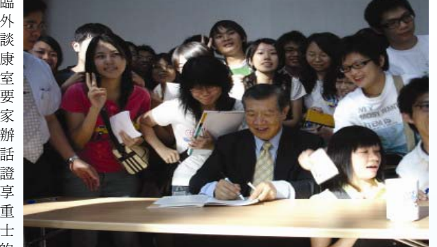
李昌鈺博士與學生合影。