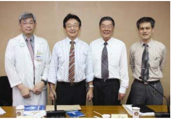
學術與研究能量說明研討會現場。

為推動本校與國立陽明大學附設醫院跨領域合作，共同提昇生物醫學的研究發展與應用，以充實教、研、學資源，特於98年3月26日(星期四)下午2時至4時假國立陽明大學附設醫院舉辦「國立宜蘭大學暨國立陽明大學附設醫院學術與研究能量說明會」，期促成學術合作契機。藉由本活動舉辦，達成三目的： 1.促進本校及國立陽明大學附設醫院跨領域學研交流。 2.探討未來學研合作之方向與方法。 3.協助國立陽明大學附設醫院員工於本校在職進修之便捷。 往後我們將持續為提升宜蘭縣學研交流發展而努力，期待未來能繼續獲得各位老師支持與指教。上圖為本校江彰吉校長、胡懷祖研發長及陽明大學附設醫院唐高駿院長(左二)、羅世薰副院長(左一)於座談會後合影。