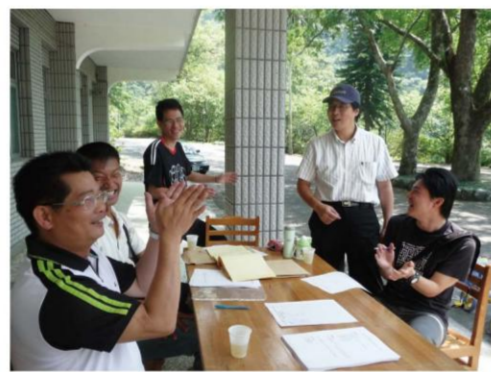
森林暨自然資源學系