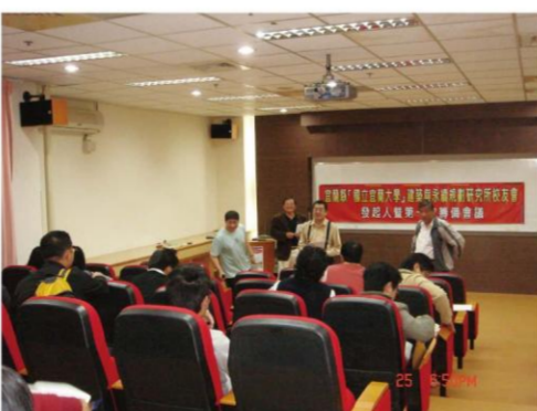
建築與永續規劃研究所