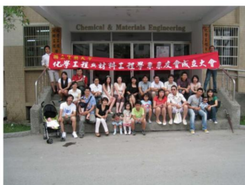
化學工程與材料工程學系