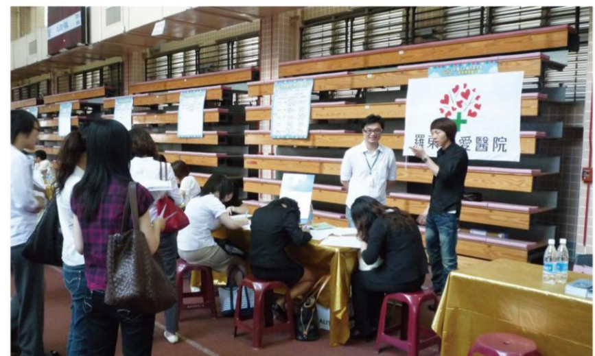
98年7月11日本校協助就業博覽會 (體育館2、3樓)

因應2008年底全球經濟危機，企業雇員緊縮，就業市場衰退，教育部於2009年初特研提此計畫供95-97學年度之大專畢業生赴全國各企業、非公立醫療及護理機構、私立幼稚園及托兒所等實習機構進行職場實習，協助大專畢業生於專長領域即時就業並貢獻所學，以提振就業市場。大專畢業生發揮專長及取得業界經驗後，待經濟復甦，俾利後續就業。